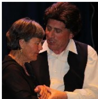
BODAS DE SANGRE en el Teatro del Carmen